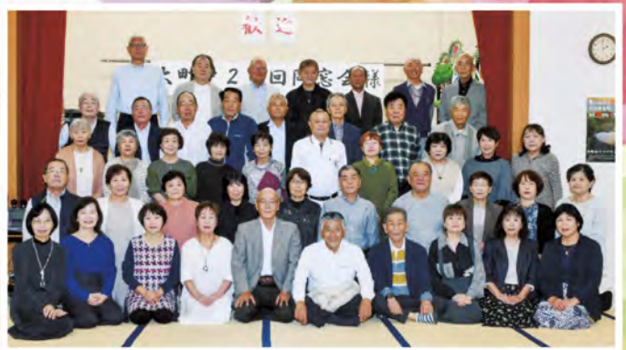
令和5年10月8日 大町中学校第20回生同窓会

令和5年10月8日に大町中学校第20回生同窓会が開催されました。大町中学校第20回生は、当時600名在籍し昭和42年に中学校を卒業しました。年齢による体調不良や介護等による理由で多くの欠席者が予想されましたが、全国から45名参加してくれました。当日は、童心にかえり、学生時代の思い出話やカラオケをして、大いににぎわい、同窓会は大成功となりました。次回は喜寿の年に再会しようとして約束し、解散しました。