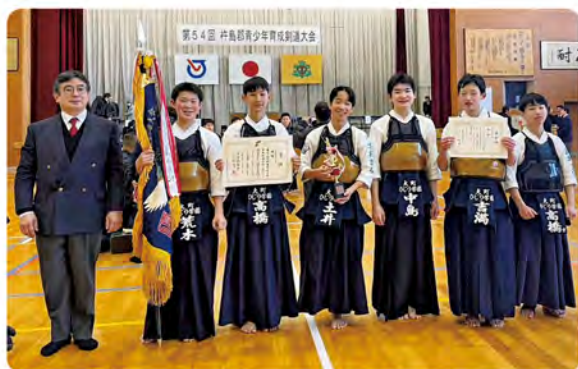
▲男子中学生団体 初優勝