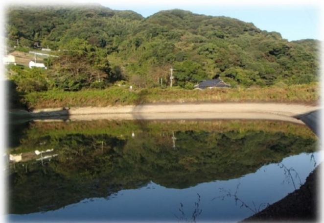
大谷口耕地整理ため池