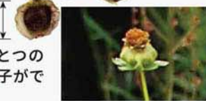
花が終わった後の頭状花