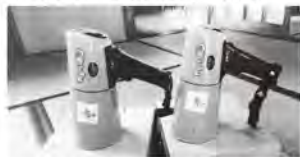
▲地域防災活動に必要な防災用ヘルメットや多機能防水メガホンなどの防災用品を整備しました。