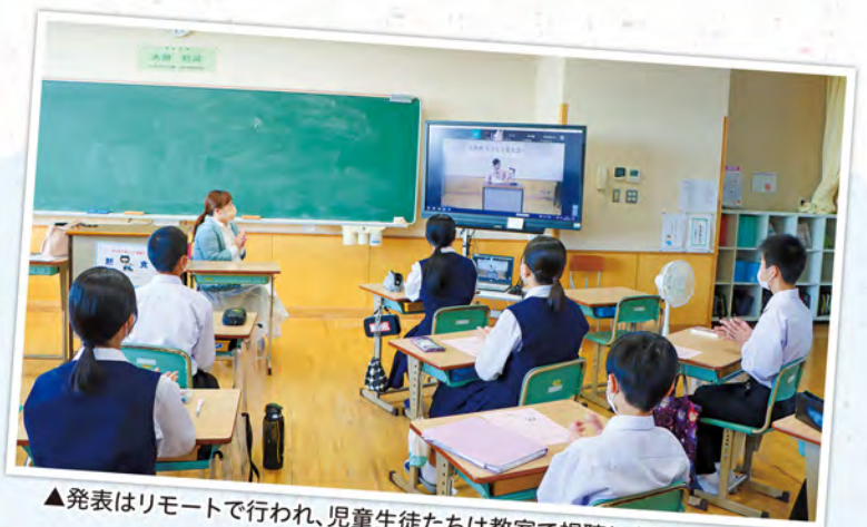
▲発表はリモートで行われ、児童生徒たちは教室で視聴しました

発表者は、自分の夢についてや日常の気付き、実体験をもとに感じたこと、戦争が巻き起こす影響や悲惨さなど、それぞれに堂々と力強い発表を行われました。