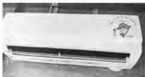
▲コミュニティ活動備品としてエアコンや液晶テレビなどの整備を行いました。