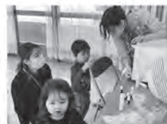
▲11月16日の子育てサークル“ふくふく”「宝石石けん作り」の様子

今月は、スポーツセンターでの外遊びを企画しています!ぜひいろんなイベントに参加してみてくださいね!