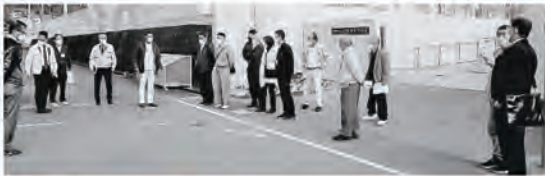
大町ひじり学園西側校門前

今後は、子どもたちの安全確保ため、歩道の設置などについて関係機関と協議をしていきます。