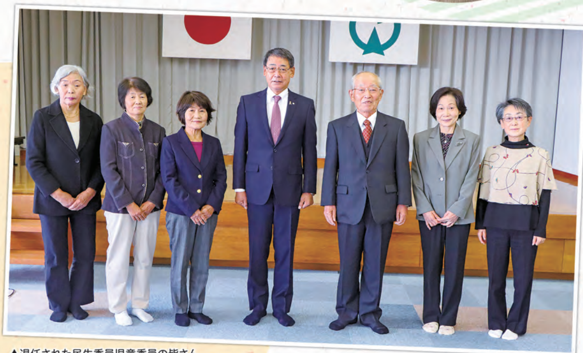
▲退任された民生委員児童委員の皆さん