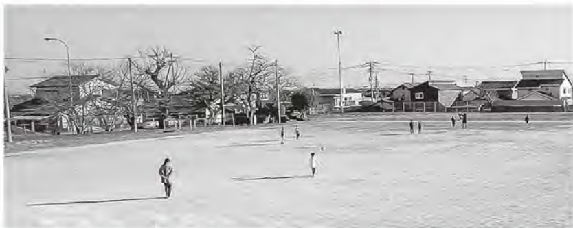
▲大町ひじり学園小学部グラウンド

南側は使用されていない。陸上部が南側を利用して練習ができるように整備ができないか。 教育長 現在のひじり学園各部活動の活動場所については、新校舎建築の際、学校で決定されたものです。 今回初めてお聞きしましたので、まずは、学校長、体育主任、陸上部顧問、陸上部外部指導者の意見を聴取したいと考えます。