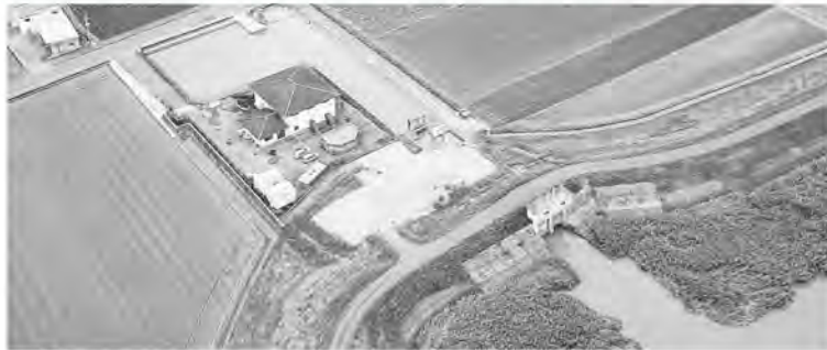
▲上空から見た下瀧排水機場

それから、今年中には、六角川流域の首長が参画する「令和元年8月六角川水系の水害を踏まえた防災・減災対策協議会」が計画されており、令和3年8月出水を踏まえた外水・内水対策について議論を交わす予定です。大町町の実情、内水被害の軽減、来年の出水期を前にした緊急的な対策の検討を議論していきたいと思っています。