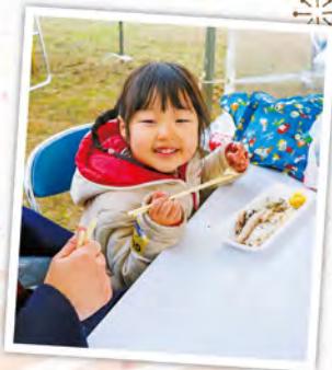
▼らんらん弾き語りライブ