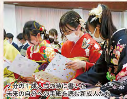
2分の1成人式の時に書いた 未来の自分への手紙を読む新成人たち