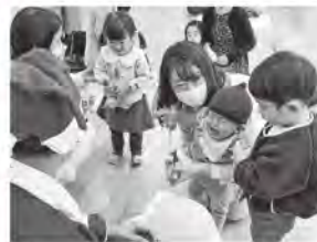
◀「クリスマス会」の様子