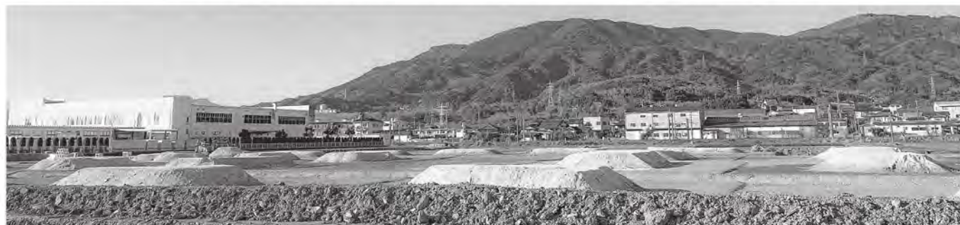
▲優良田園住宅の建設予定地