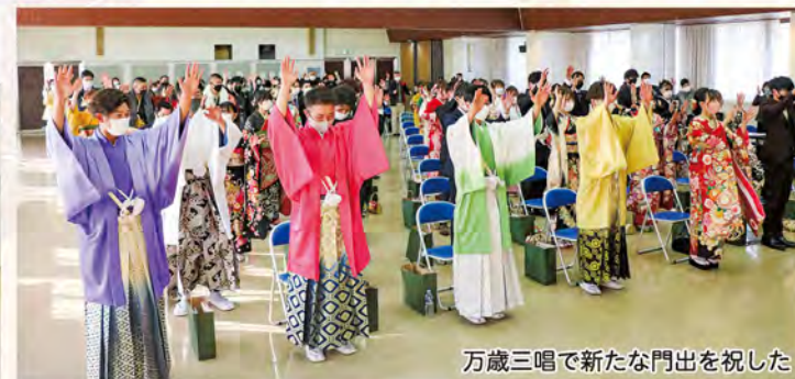
万歳三唱で新たな門出を祝した