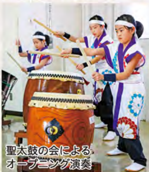
聖太鼓の会による オープニング演奏