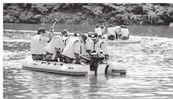
▲救命ボート訓練の様子

町長 ①町の重要な役割として「人命第一、逃げ遅れゼロ」を念頭に置いており、令和元年8月豪雨を受け、救命ボートを増備し、消防団訓練を実施、屋外防災無線のほか、適時的確な情報伝達のための防災ラジオや、避難ルートの確認など防災意識向上のために、防災マップを改訂し、ため池ハザードマップを含め全市帯に配備しました。