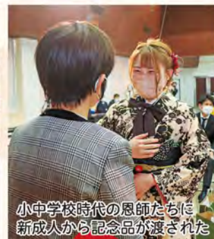
小中学校時代の恩師たちに 新成人から記念品が渡された