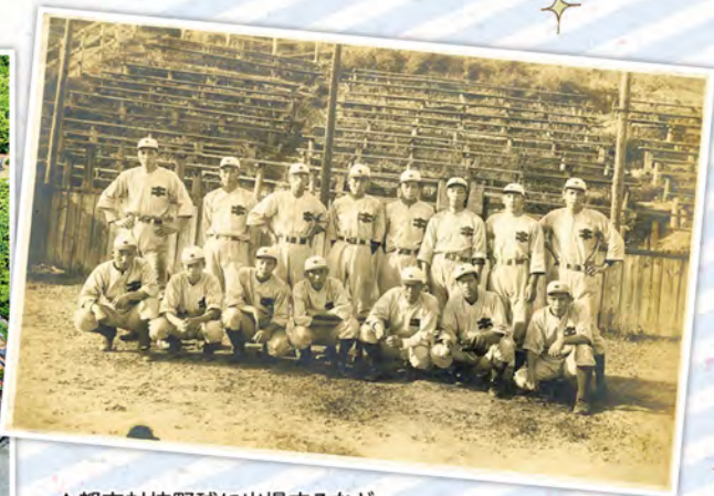
▲都市対抗野球に出場するなど 全国レベルの活躍を誇った杵島炭鉱野球部 (町公民館蔵)