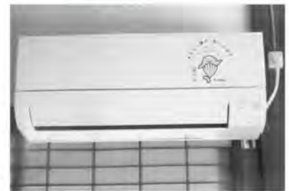
▲地域交流拠点となっている公民分館にエアコン、テレビ、ソファ、照明などのコミュニティ活動備品を整備しました。