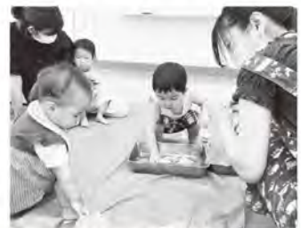
▲7月27日実施の子育てサークル “寒天遊び”の様子

さて、9月の子育てサークルふくふくの予定は、 “ちぎり絵お月見うさぎ”と“運動遊び”をします。ま た、9月10日(土)9:30~12:00には大町公民館で白 石高校生が企画・実行のこども・あそび・マルシェ を行います。乳幼児 さんから小学生ま でいろんな年齢の 子どもたちが楽し めるイベントを準 備しています。9月 も多くの皆さんの 参加お待ちしております！