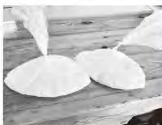
▲万能ポリ袋「アイラップ」で簡単 に炊飯ができます

出張講座も行ってい ますし、アイラップに 興味がある人はペリ ドットまでご相談くだ さい。調理方法も難し くないので、一度晩御 飯の際に練習してみ てはいかがでしょうか。