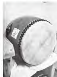
▲コミュニティ活動備品として和太鼓の整備を行いました。