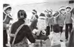
▲子育てサークル“ふくふく” 「クリスマス会」

子育てサークルにもペリドットにも、たくさん子どもたちが遊びに来てくれるのをお待ちしております！