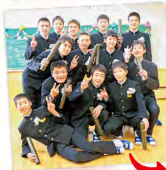
大町ひじり学園 卒業から5年