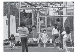
▲1月15日の「子どもの遊び場」

また、3月のペリドットでは「工作デコレーションクッキー」と「子どもの遊び場」を実施します。今月の子どもの遊び場はスポーツセンターとなります。イベントがあるときもないときも誰でもペリドットに遊びに来てくれるのをお待ちしております！