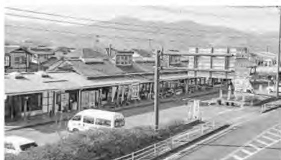
▲おおまち情報プラザ