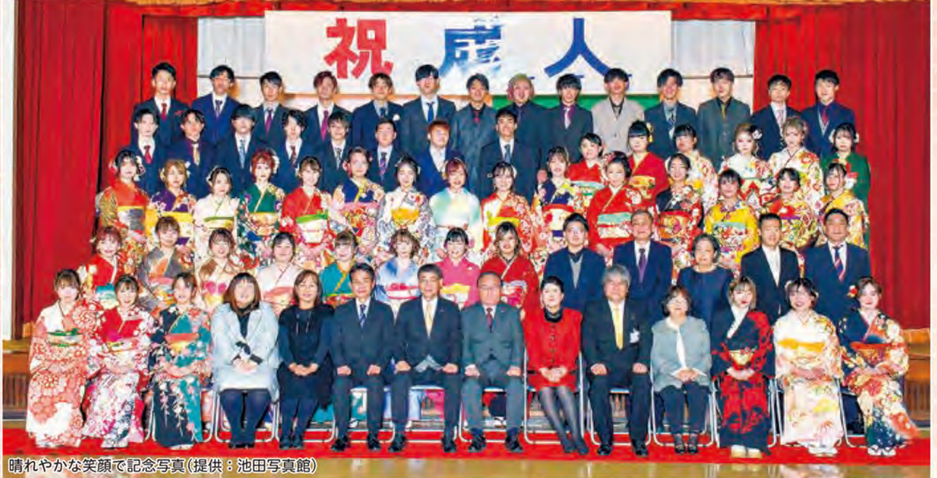
晴れやかな笑顔で記念写真