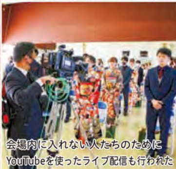
会場内に入れない人たちのために YouTubeを使ったライブ配信も行われた