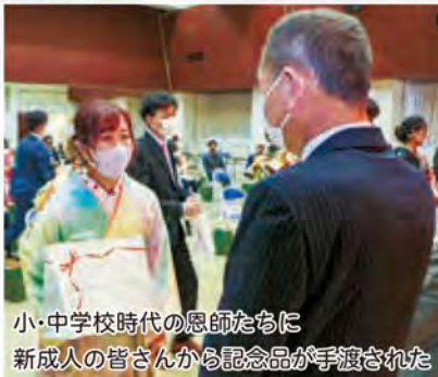
小・中学校時代の恩師たちに 新成人の皆さんから記念品が手渡された