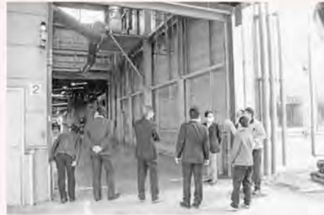
▲工場内熱処理施設の防水壁