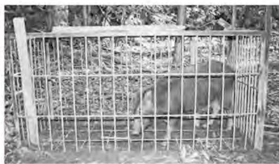
▲箱籠に入ったイノシシ(写真はイメージ)

ただ、白石・江北両町の考えや情報もお聞きしたいと思えますので、両町長にお話をさせていただき、まずは、3町での協議の場を設けたいと考えます。しばらく時間をいただきたいと思えます。