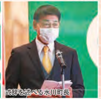
式辞を述べる水川町長