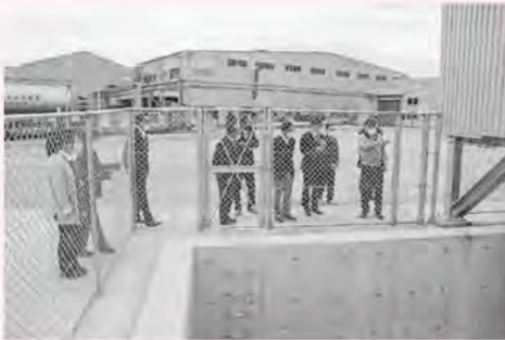
▲工場内水排水設備

工場敷地内の防水外壁(2区分分)、工場内熱処理施設の防水壁、工場内水排水設備、非常用電源設備など、説明を受けながら視察しました。