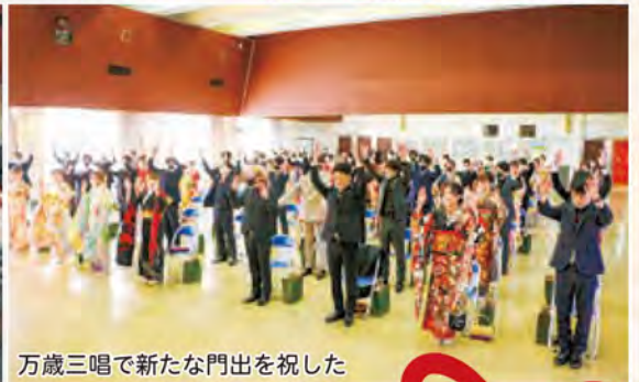
万歳三唱で新たな門出を祝した