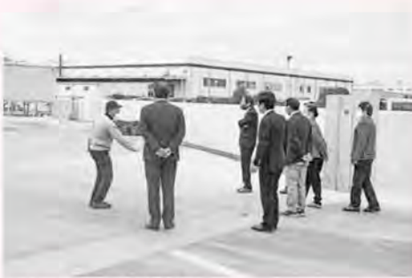
▲工場敷地内の防水外壁