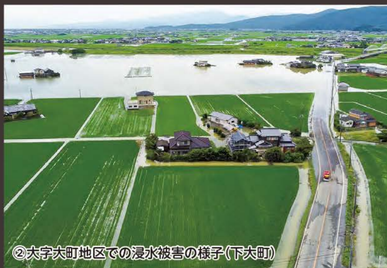
②大字大町地区での浸水被害の様子(下大町)