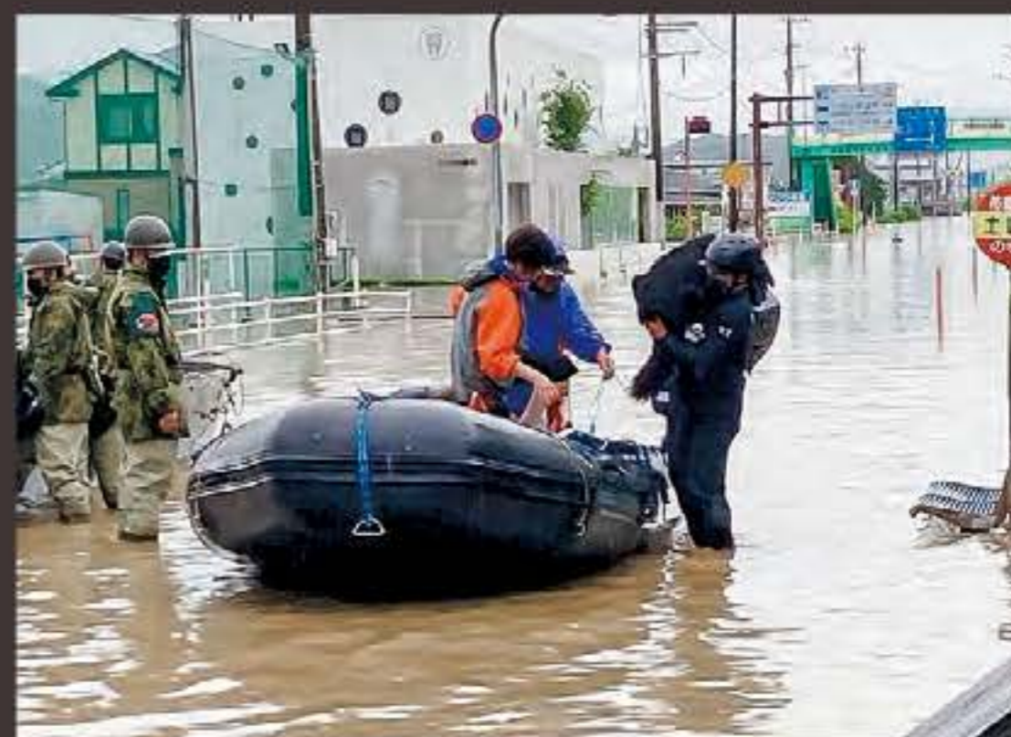
④救助活動にあたる自衛隊員