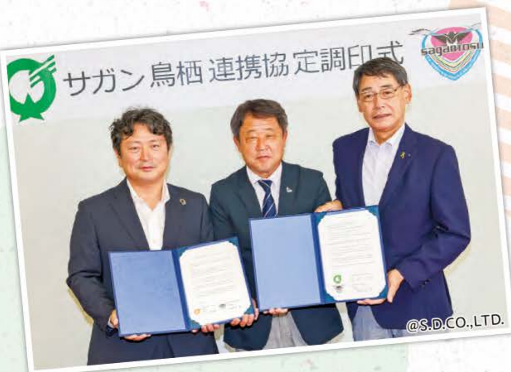
▲左から、江北町山田町長、(株)サガン・ドリームス福岡代表取締役、水川町長