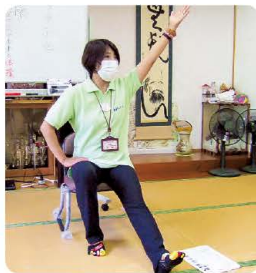
栄町 サクランボ会