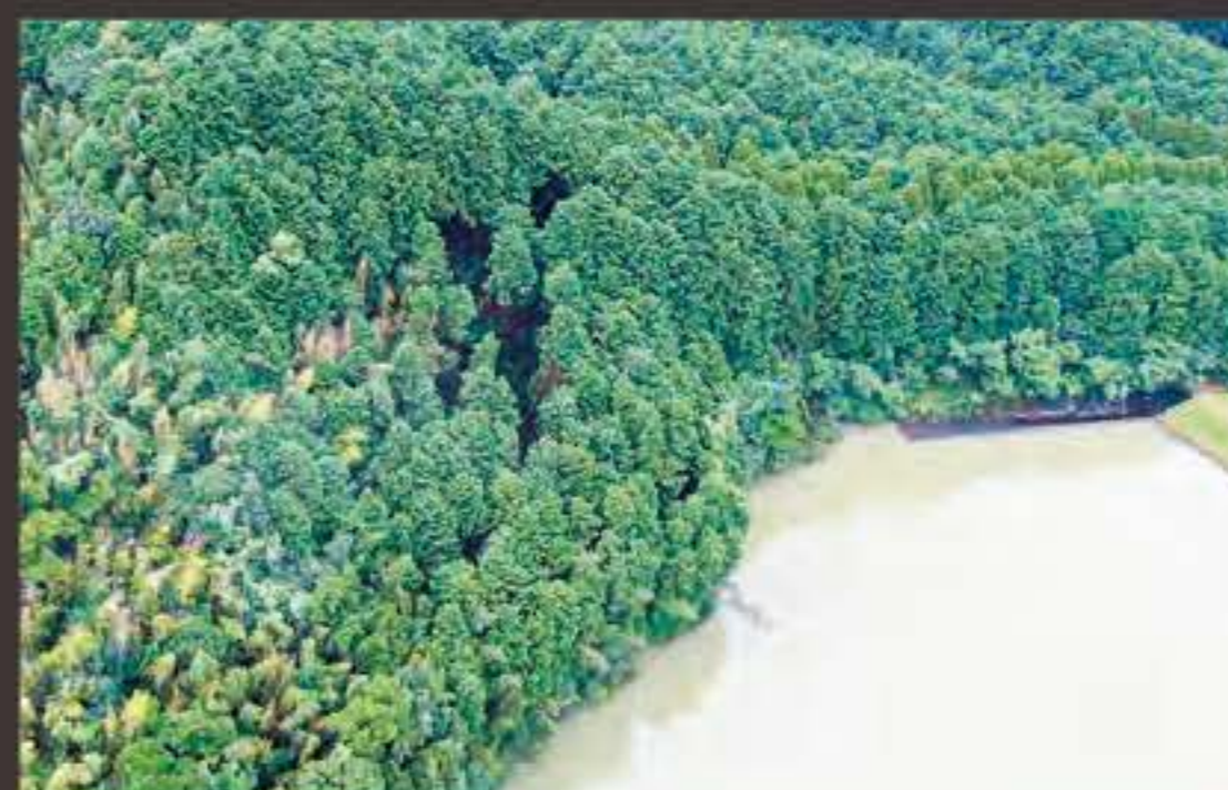
⑤砥石川ため池付近の山で亀裂が生じた