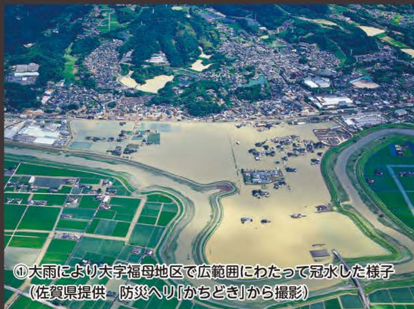
①大雨により大字福母地区で広範囲にわたって冠水した様子 (佐賀県提供 防災ヘリ「かちどき」から撮影)