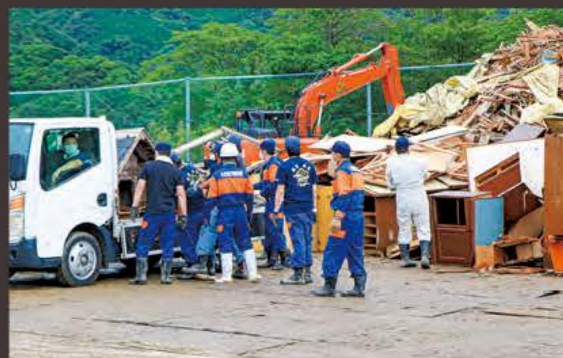
③被災ごみの受け入れにあたる消防団