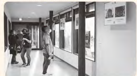
駅の跨線橋に展示された手形アート