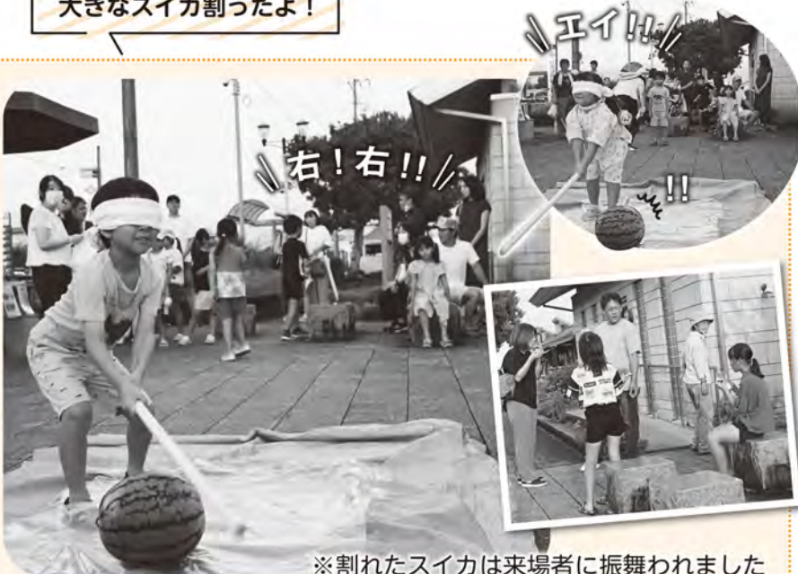
大きなスイカ割ったよ!