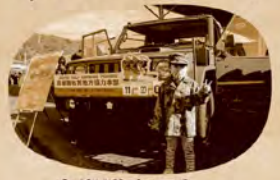
自衛隊車両& こども自衛隊服体験