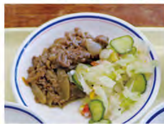
▲佐賀牛を使ったメニュー 「牛肉のステーキソース」

児童生徒らは「ジューシーでおいしい」「すごく柔らかい!また食べたい」と、地元佐賀が誇る佐賀牛の味を堪能していました。