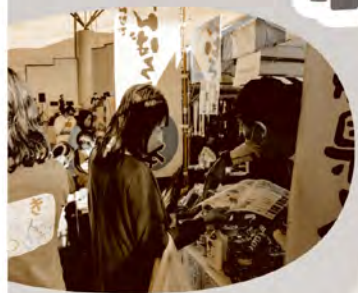
被災地支援ブース