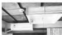
▲エアコン・照明器具

エアコンや照明器具、テレビ、草刈り機等の備品を購入し、コミュニティ活動環境の整備を行いました。