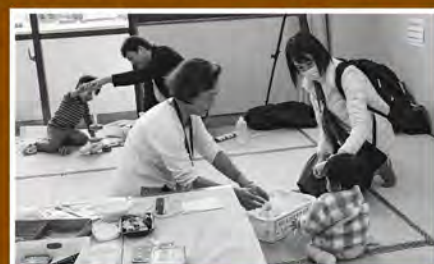
▲手作りおもちゃのワークショップ