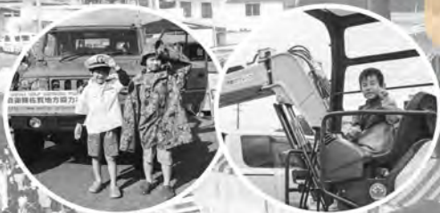
▲災害時に活躍する車両展示