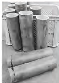
▲油抜き後に切りそろえた竹