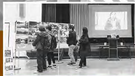
▲災害支援団体活動パネル展示