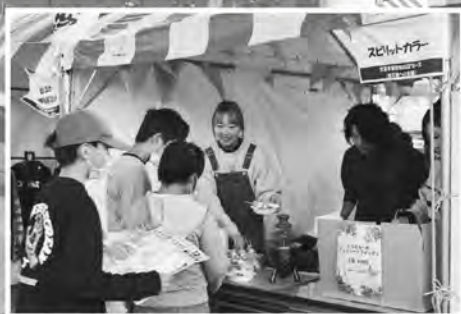
▲災害支援団体による出店