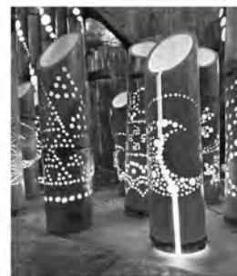
▲優しい光を灯す竹灯籠