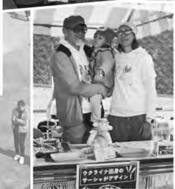
▲ウクライナひまわりプロジェクト