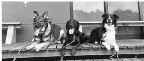
モアワン(住所:大町町大字大町2071-4) ☎77-0231