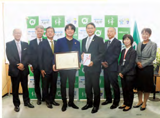
▲辻CEO(写真中央左)と水川町長(写真中央右)

この寄附金は、SDGsの進展への貢献を目的とする佐賀共栄銀行の寄附型私募債「きょうぎんSDGs私募債」を活用されご寄附いただいたものです。今後は大町保育園の環境整備の充実のために有効に活用されます。