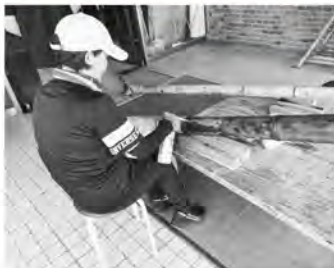
▲ガスバーナーを使った油抜き(火抜き)の様子

竹は油分が多い植物なので、余分な油抜きをすることでツヤ出しや耐久性を向上することができます。油抜きの方法は、ガスバーナーや炭火を使う「乾式(火抜き)」と熱湯を使う「湿式(湯抜き)」があります。