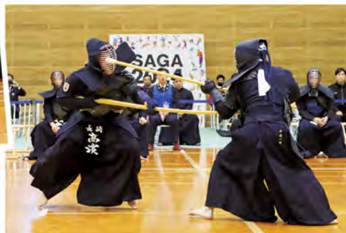
▲決勝の決め手となった強烈な一本(成年の部)