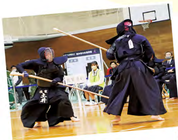
▲積極的に攻め込む佐賀チーム(少年の部)